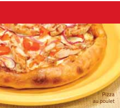
Pizza au poulet