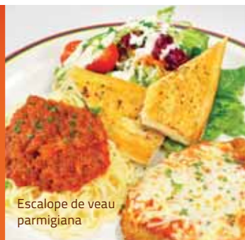
Escalope de veau parmigiana

SERVIE AVEC SPAGHETTINI À LA VIANDE OU LINGUINE ALFREDO 17.95