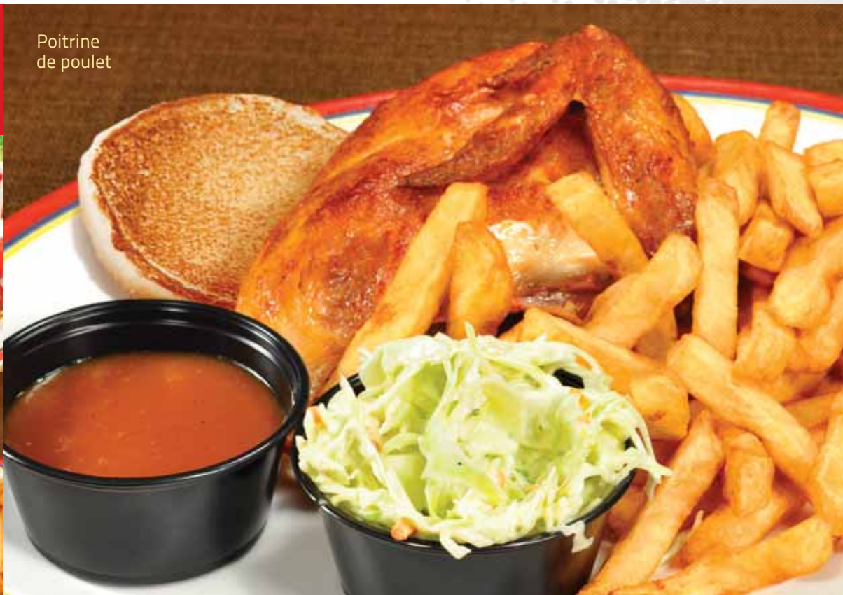
Poitrine de poulet