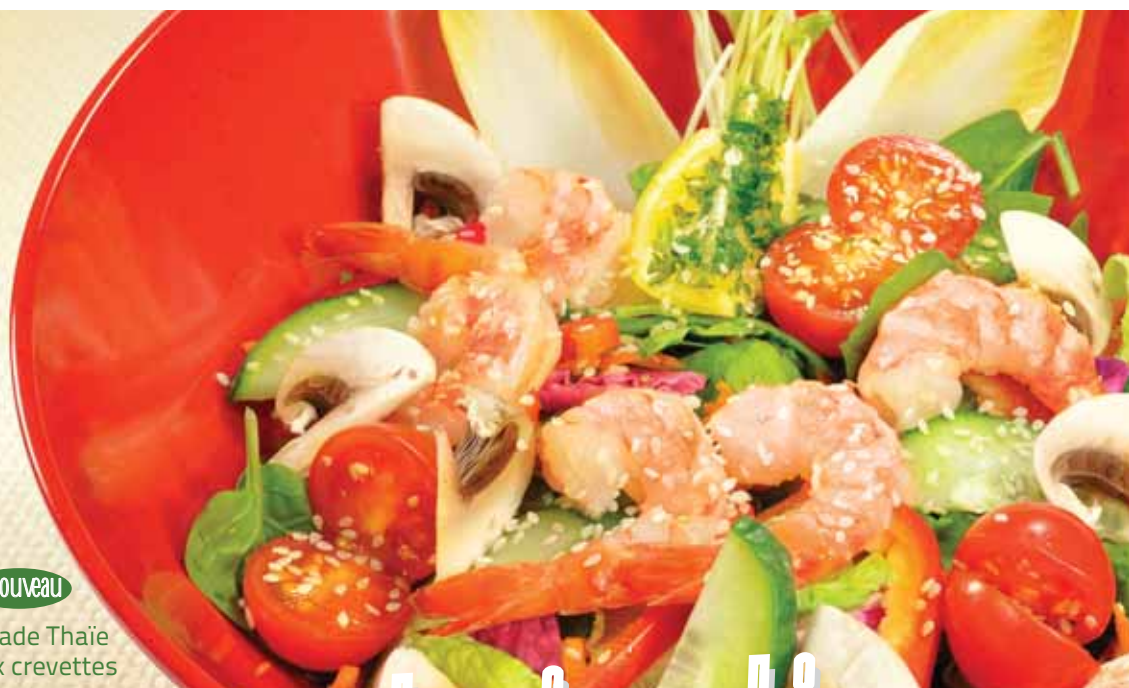
Salade Thaïe aux crevettes