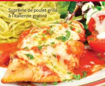
Suprême de poulet grillé à l'italienne gratiné

Pizza garnie et lasagne sauce à la viande 12.50