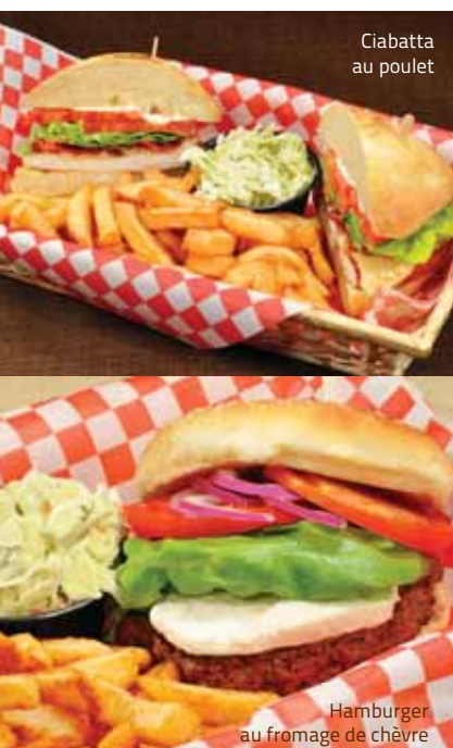
Ciabatta au poulet